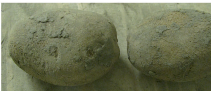
Innovator traité au 1,4SIGHT®