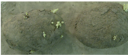
Innovator traité avec référence